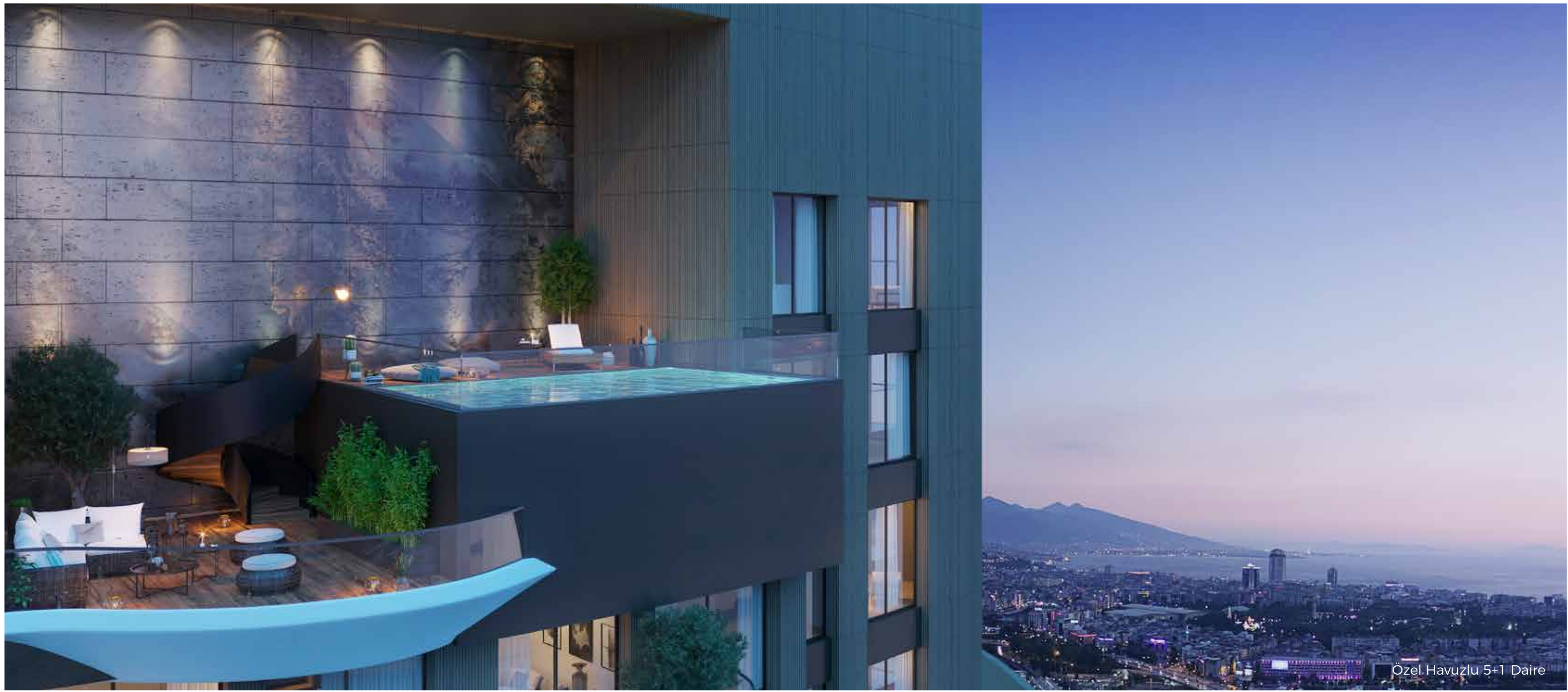
Özel Havuzlu 5+1 Daire