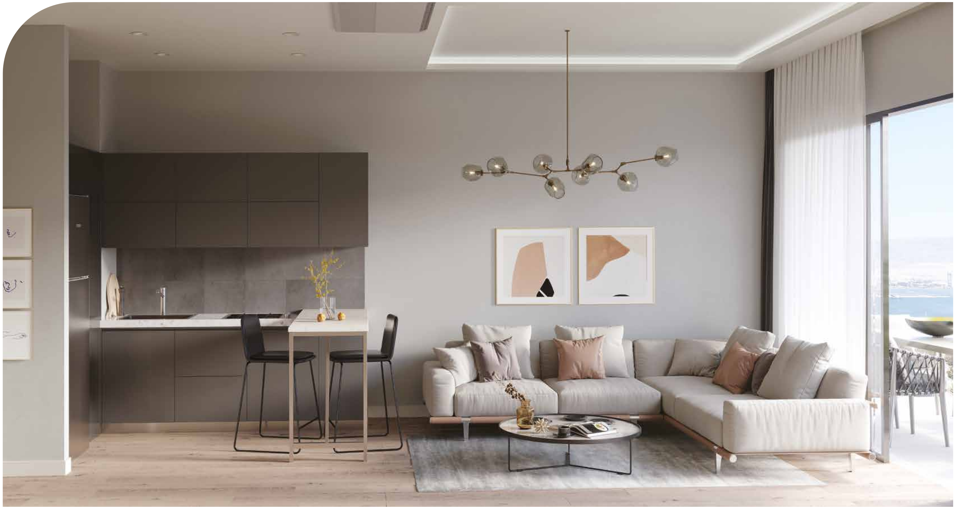
Salon & Mutfak / Yatak Odası 1+1